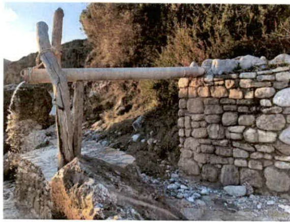
izrada zida L=8m u nastavku postojećeg