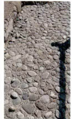
betoniranje pješačke staze u dužini cca 50m